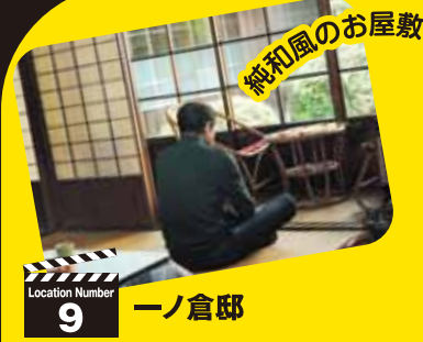
Location Number 9 一ノ倉邸

盛岡南公園内にある、サッカーやラグビーなどの球技専用スタジアム。壮介の母校・南部高校が、強豪・水沢学院とラグビーの試合を行うシーンが撮影された。