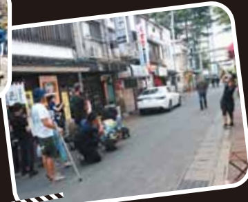
Location Number 3 桜山神社通り

盛岡市内丸の昭和の面影を残す商店街。元祖盛岡じゃじゃ麺の店や居酒屋が立ち並び、サラリーマンや観光客で賑わう。映画では、壮介が歩いているシーンを撮影した。