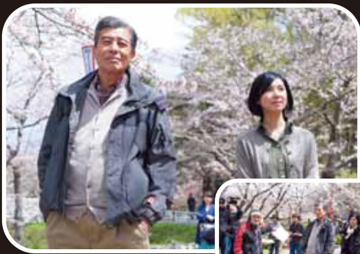
みことな桜の下でロケ! Location Number 2 高松公園 高松の池

盛岡市の花見スポットのひとつ。「日本さくらの名所100選」にも選ばれている。物語の序盤、美容室に迎えに来た壮介と千草が歩いた桜並木として登場。