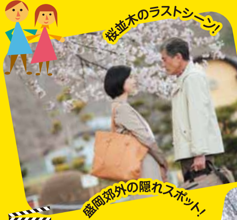
Location Number 1 米内浄水場

盛岡市郊外にある、同市で最も古い浄水場。場内のヤエベニシダレヒガンザクラは5月上旬に見頃を迎える。浄水場は普段立ち入り禁止だが、桜の開花時期だけ一般公開され、多くの花見客が訪れる。映画では、壮介の同級生・工藤が立ち上げた「NPO法人・岩手復興ネットワーク」の事務所と、壮介と千草が歩く桜並木のラストシーンで登場した。