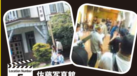
Location Number 5 佐藤写真館

カナダ・ビクトリア市との姉妹都市提携10周年を記念し、中津川沿いの一部をビクトリアロードと名付けた。壮介と二宮や工藤、同級生が歩くシーンで登場。