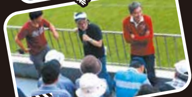
Location Number 8 盛岡南公園運動場 いわぎんスタジアム

盛岡南公園内にある、サッカーやラグビーなどの球技専用スタジアム。壮介の母校・南部高校が、強豪・水沢学院とラグビーの試合を行うシーンが撮影された。