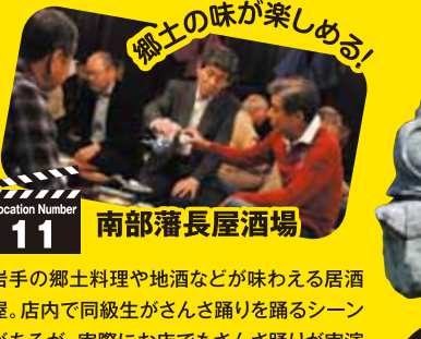
Location Number 11 南部藩長屋酒場

明治後期、盛岡市出身の政治家・阿部浩により造られ、昭和49年に保護庭園に指定された。壮介の実家のシーンとして登場。