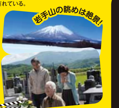
Location Number 12 玉山門前寺地区

盛岡市の南東部に位置。以前は大ヶ生小学校として利用されていた。教師だった壮介の父の回想シーンが撮影された。