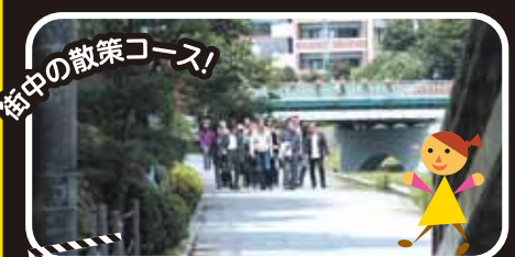
Location Number 4 中津川河畔ビクトリアロード

カナダ・ビクトリア市との姉妹都市提携10周年を記念し、中津川沿いの一部をビクトリアロードと名付けた。壮介と二宮や工藤、同級生が歩くシーンで登場。