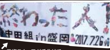
美術スタッフが手作りで一人一人の写真を組み合わせてタイトル看板にしたものです。

盛岡南インターチェンジ近くにある、地域密着の病院。映画では、義理の母が利用する老人施設「ビデオレター」のシーンが撮影された。