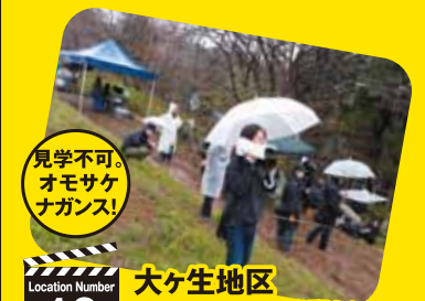
Location Number 10 大ヶ生地区 旧大ヶ生ふるさと学習センター

岩手の郷土料理や地酒などが味わえる居酒屋。店内で同級生がさんさ踊りを踊るシーンがあるが、実際にお店でもさんさ踊りが実演されている。