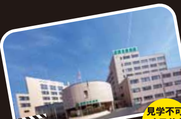
Location Number 6 盛岡友愛病院

盛岡南インターチェンジ近くにある、地域密着の病院。映画では、義理の母が利用する老人施設「ビデオレター」のシーンが撮影された。